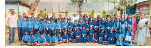
करंदी (ता.भोर) : जिल्हा परिषद शाळेस भेट देणारे फिलिपाइन्स देशाचे नागरिक व विद्यार्थी, शिक्षक.

घेण्यासाठी पोवेदा फाउंडेशन पुढाकार घेते. या फाउंडेशनशी दर आठवड्याला झूम क्लासद्वारे अनेक देशांतील विद्यार्थी जोडले जातात. त्यातून विद्यार्थ्यांचे इंग्रजी व्याकरण विकसित केले जाते. या फाउंडेशन अंतर्गत गेल्या चार पाच वर्षांपासून जिल्हा परिषद प्राथमिक शाळा करंदी खेडे बारे हे गावही जोडले आहे. त्याचा विद्यार्थ्यांना लाभ मिळतो. यातूनच पोवेदा फाउंडेशननी शाळेसाठी अभ्यासक्रम अॅड करून टॅब दिलेले