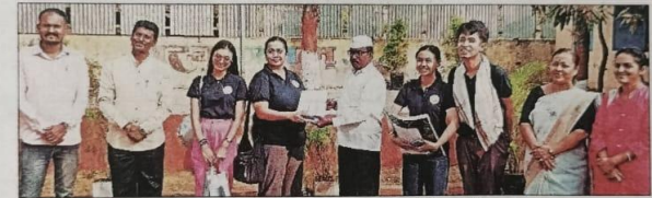
महडे (ता. भोर) : करंदी खे.बा. शाळेतील उपक्रमात सहभागी पोवेदा फाउंडेशनचे प्रतिनिधी.

गेल्या चार-पाच वर्षांपासून ही शाळा पोवेदा फाउंडेशनशी जोडलेली आहे. फाउंडेशनने शाळेला विशेष अभ्यासक्रम आणि शैक्षणिक वापरसाठी टॅब उपलब्ध करून दिले आहेत. दररोज विविध इयत्तांमधील मुले